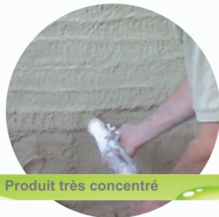
Produit très concentré

L'utilisation d' AKTIV dans la préfabrication avec étuvage permet une importante économie d'énergie de température et une augmentation des cadences de fabrication.