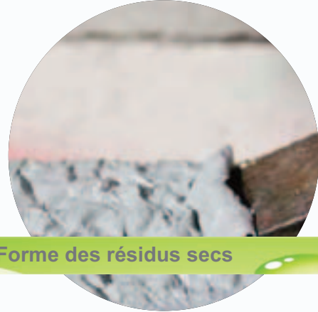
Forme des résidus secs

DECAP 77 est un produit de nouvelle génération liquide pulvérisable qui agit sans rinçage en formant des résidus secs.