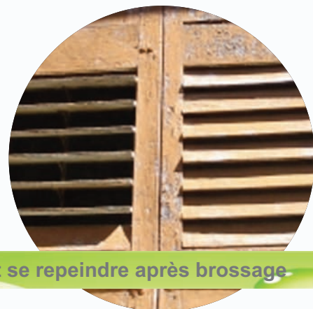
Peut se repeindre après brossage