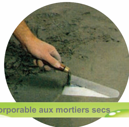
Incorporable aux mortiers secs