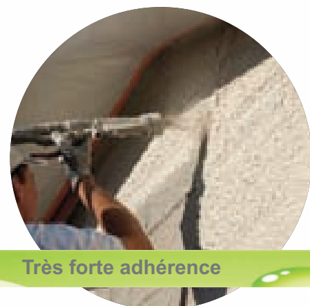
Très forte adhérence