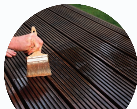
Sature le bois