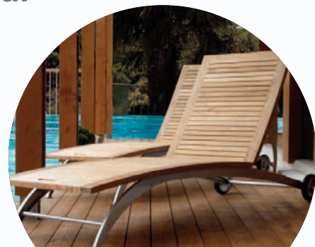
Aspect naturel satiné

Afin de renforcer la tenue au U.V. il est conseillé d'utiliser l'anti U.V. BOOST .