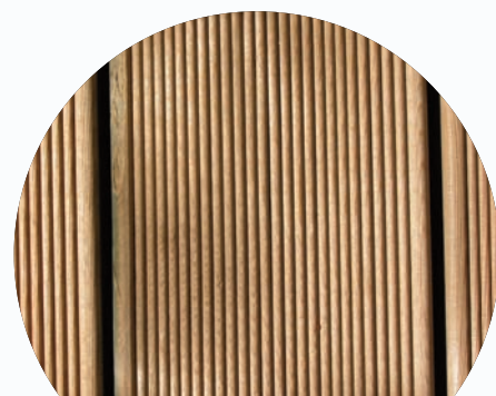
Exempt de C.O.V.